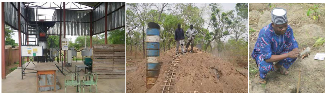
Des de COFOR-Internacional es promouen accions a les forests comunals de països en desenvolupament; alguns exemples: generador elèctric amb biomassa amb cloves de cacauets a Po (Burkina Faso) / Pila carbonera al bosc comunal de Kalounayes (Senegal) / Plantació d'un tallafocs al bosc comunal de Tchaourou (Benin)

COFOR-Internacional es una associació d'entitats forestals municipals a on ELFOCAT hi va ingressar com a membre de pel dret aquest 2013, i que està liderada per la Federació Francesa de Municipis Forestals (FN-COFOR), i de la que son membres la Federation Europeenne des Communes Forestieres (FECOF), i diverses associacions de Communes Forestières de França moltes d'elles vinculades a l'Unión du Grand Sud (UGS), així com altres associacions municipals forestals del món (Camerun, Benin, Costa d'Ivori, Burkina Faso, Equador...).