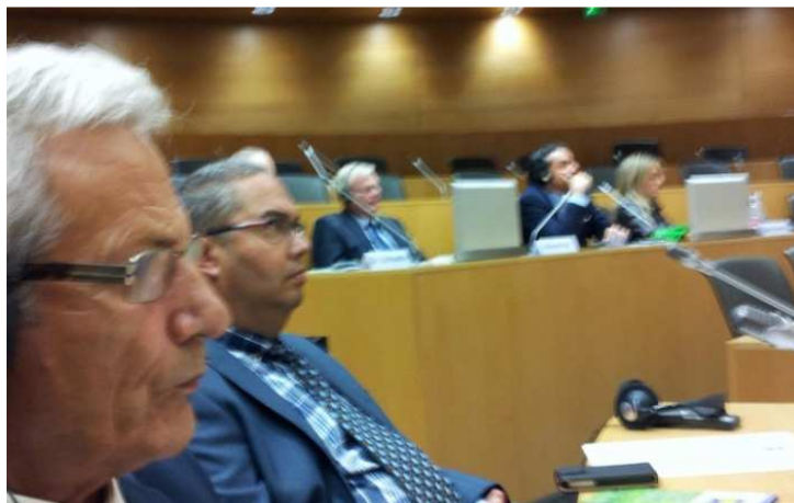
Membres d'ELFOCAT a la reunió de al FECOF d'Estrasburg 2013

A la reunió es va insistir en el paper dels municipis propietaris de boscos i a la necessitat de millorar alguns aspectes en el que resultem afectats (compensacions econòmiques, Xarxa Natura 2000, planificacions, tramitacions..)