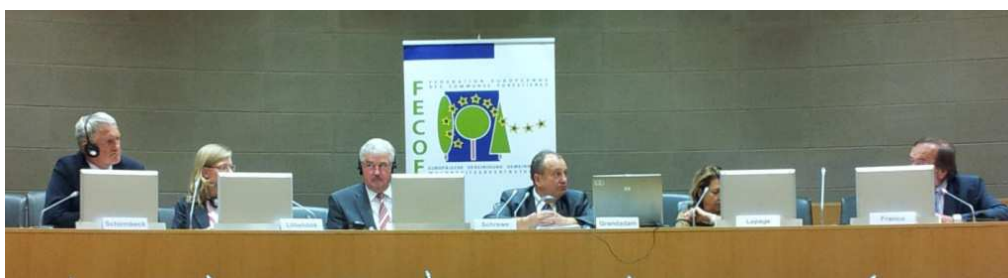
Mesa que presidia la reunió de FECOF a Estrasburg el setembre del 2013

REUNIO FECOF ESTRASBURG: L'11 de setembre de 2013 va haver-hi una important reunió de la FECOF ( Federation Europeenne des Communes Forestieres ), amb presència de diputats europeus i de les associacions de propietaris forestals municipals europees, on va assistir ELFOCAT, com a membre de ple dret, per tal de informar de l'importantíssim paper que juguen els boscos i els municipis en l'economia, i el medi ambient europeu. La reunió s'emmarcava dins els moviments que tenen lloc a Europa per tal de definir una nova estratègia forestal (recordem que els temes forestals varen quedar fora del tractat i que per tant es un tema no directament competencial, de moment, a la UE). De fet pocs dies després de la reunió, el 20 de setembre de 2013, la Comissió presentava públicament una nova estratègia forestal europea basada en un enfocament nou, més ampli, del paper dels boscos. Aquesta nova estratègia ha de ser estudiada, ara, pel Parlament Europeu i pel Consell.