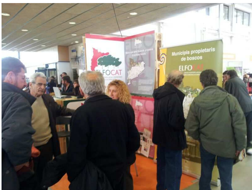
Visió del stand institucional d'ELFOCAT a la Zona Fira de la Biomassa a Vic, febrer de 2013

ELFOCAT considera que fomentar l'ús de la biomassa forestal com a font d'energia es una oportunitat per valoritzar la producció dels boscos i millorar la seva gestió. En aquest sentit, entre altres accions, ha volgut estar present a la Zona Fira de la Biomassa de Vic 2013, i ha distribuït informació sobre l'ús de biomassa forestal per energia tant als seus associats com a tots els ens locals propietaris forestals de Catalunya.